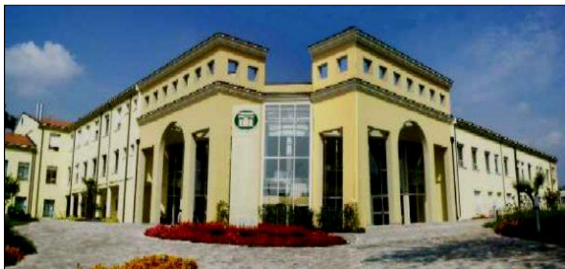
* Residenza Villa Arcadia - Bareggio